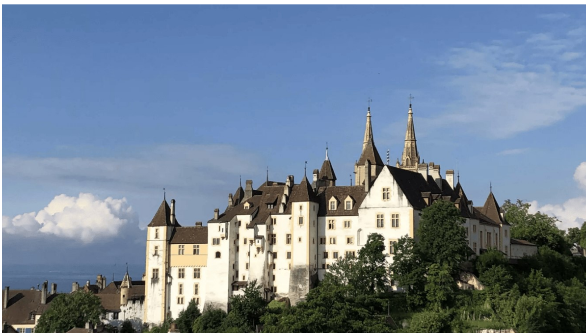
Illustration : Vue du Château de Neuchâtel.

Le 18 mai 2026, le Conseil d'État a adopté le Règlement d'application de la loi sur l'encouragement des activités culturelles et artistiques (RELEAC). Ce texte réglementaire encadre concrètement la mise en œuvre de la nouvelle loi, elle-même adoptée par le Grand Conseil en septembre 2024.