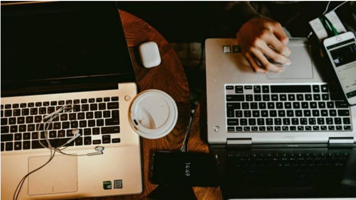
Illustration : Visuel lcdf27. Crédit : lcdf27.

Dès le 31 août 2026, un nouvel outil de dépôt des demandes de soutien viendra remplacer Culturac, la plateforme existante.