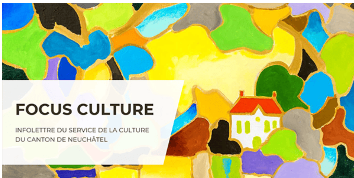
Illustration : Aloys Perregaux, Bords de l'Areuse *